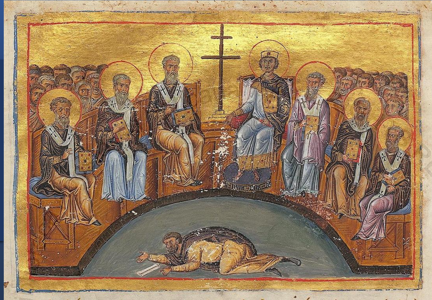
Rappresentazione del Secondo Concilio di Nicaea dal Menologio di Basilio II 976–1025 (Vat. gr. 1613. Fol. 108)