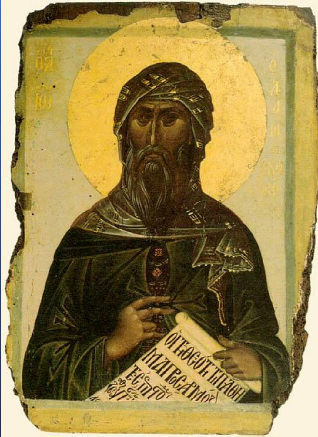
Giovanni Damasceno Icona del Monte Athos datata all’inizio del XIV secolo