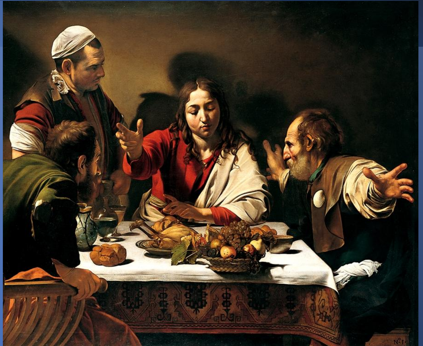
Caravaggio Cena in Emmaus , 1601-02 National Gallery, Londra