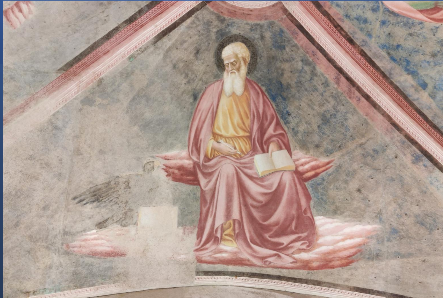
Masolino da Panicale San Giovanni Evangelista con a fianco il suo simbolo, l'aquila, 1435 Battistero di Castiglione Olona (Varese)