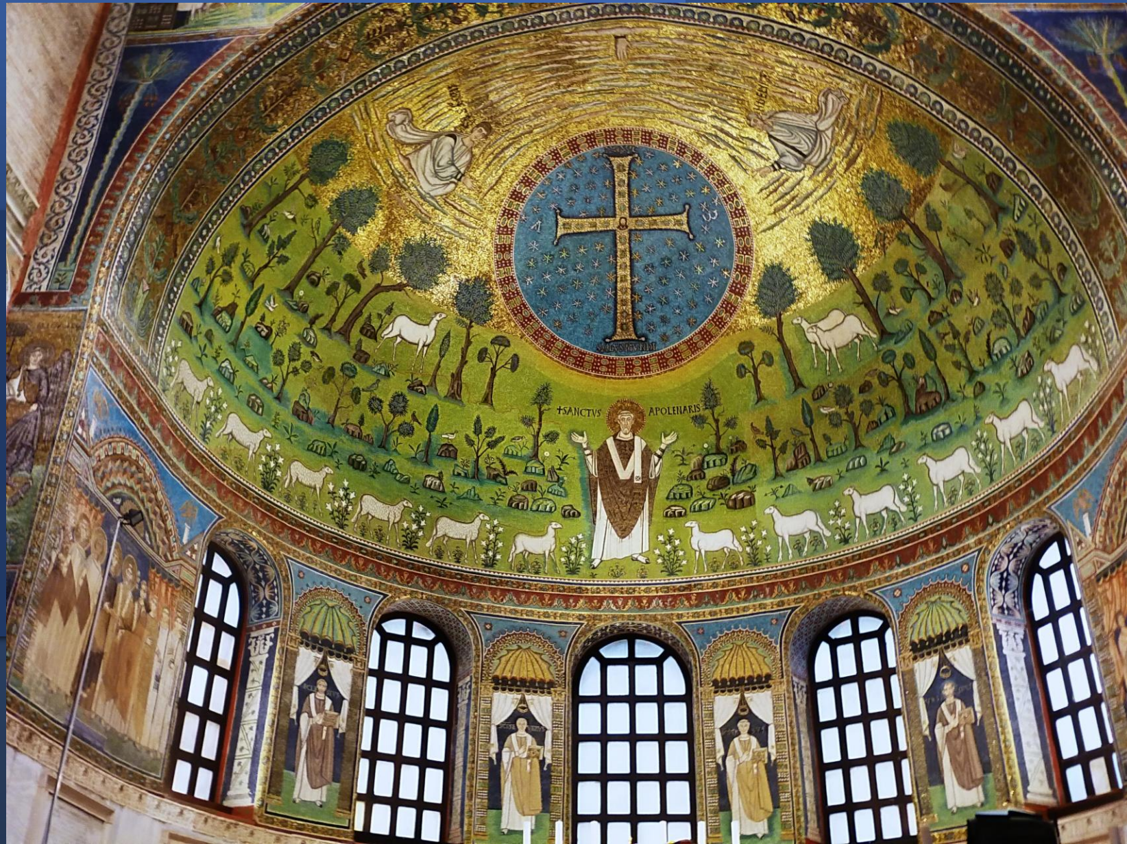
Il mosaico absidale, metà del VI secolo Basilica di Sant'Apollinare in Classe Ravenna