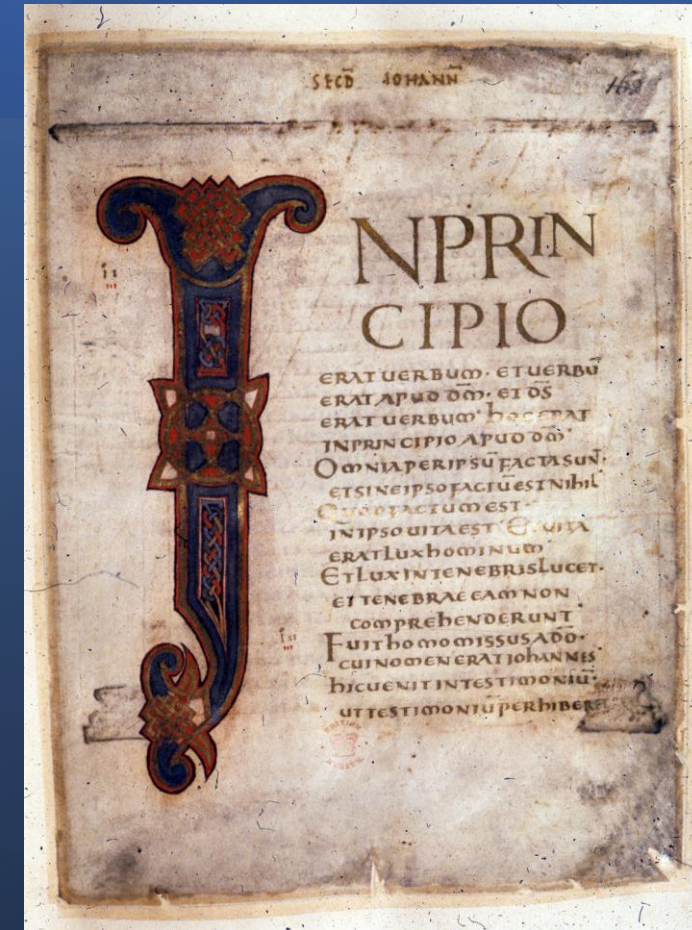
Prima pagina del Vangelo di Giovanni dai Vangeli dell'Incoronazione, X secolo.