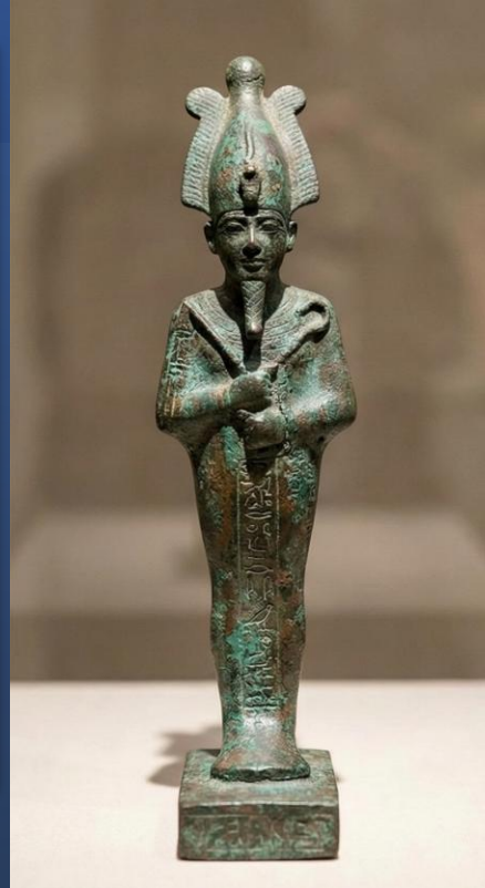
IDOLO ANTICO VS ICONA CRISTIANA