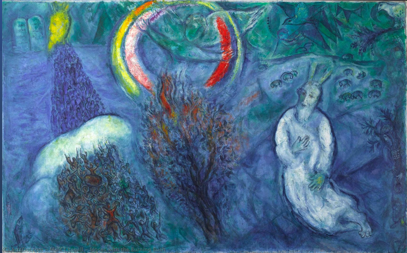
March Chagall Mosè con il rovelto ardente, 1966 Museo Nazionale del Messaggio Biblico Marc Chagall , Nizza