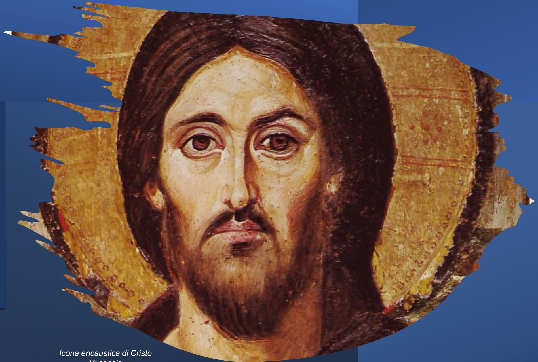
Icona encaustica di Cristo VI secolo Monastero di Santa Caterina Sinai del Sud, Egitto