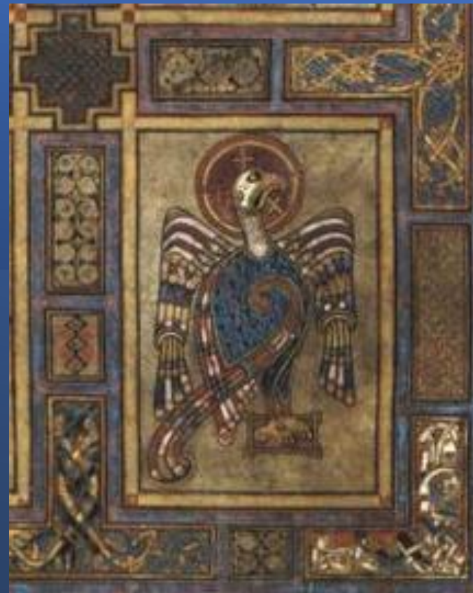
L'evangelista Giovanni viene anche designato Aquila Spirituale per via della profondità della sua visione teologica