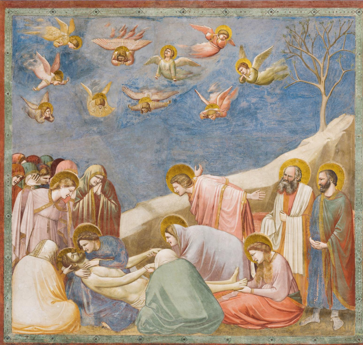
Giotto Compianto sul Cristo morto, 1303-05 circa Cappella degli Scrovegni, Padova